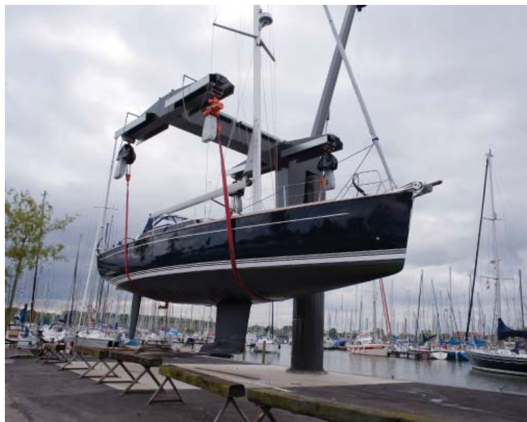
Hijsbanden voor botenlift